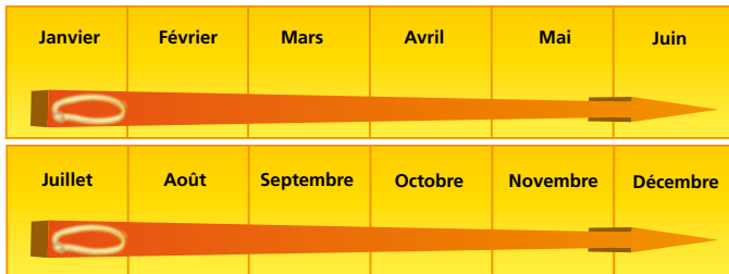
Durée d'efficacité du collier